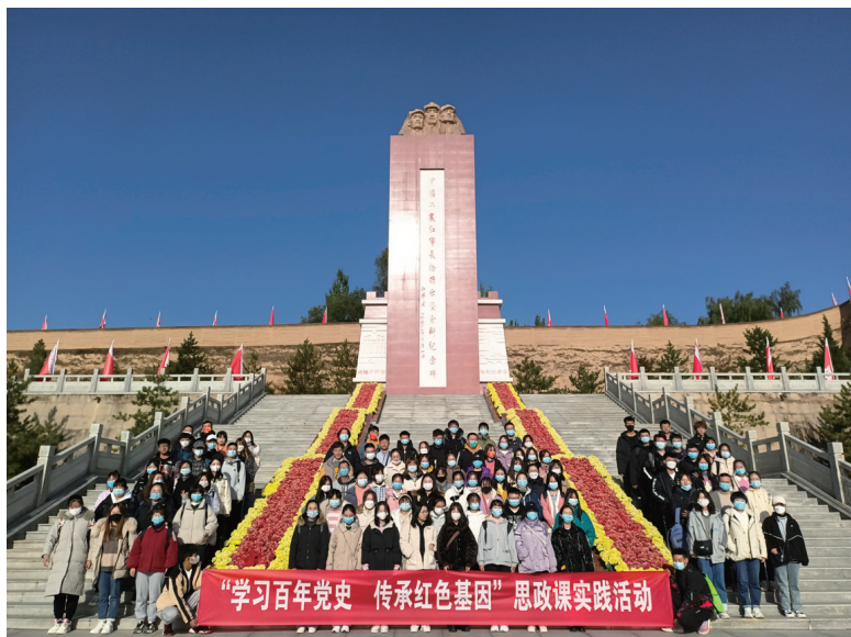
▲宁夏师范学院学生在将台堡会师纪念碑前合影留念

坚持系统推进，拓展工作“大格局”。 一是高位推动统筹发力。自治区党委常委会每年召开会议，谋划部署，把好政治方向，及时解决问题。各级党委教育工作领导小组将思政课建设纳入年度工作要点，定期召开会议研究思政课建设相关工作，指导各成员单位全面落实大中小学思政课建设重点任务。印发《关于进一步加强新时代中小学思政课建设的实施意见》，将中小学思政课建设情况纳入各级党委领导班子考核和政治巡视巡察内容，形成思政课一体化建设新生态。建立健全党委统一领导、党政齐抓共管、有关部门各负其责的“大思政”新格局。二是健全机制精准发力。成立全区大中小学思政课一体化建设指导委员会和专家委员会，分层次、分类别成立9个“习近平新时代中国特色社会主义思想概论”“马克思主义基本原理”“中华民族共同体概论”等思政课课程建设委员会、7个大中小学思政课建设联盟，负责思政课的专业建设、教学指导、师资培训、教学质量评价与监测、教学理论与实践研究等工作。落实自治区省级领导和各