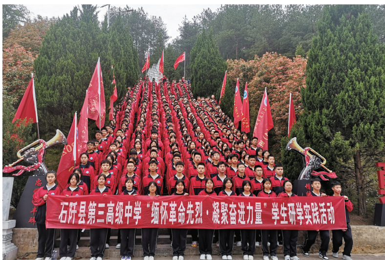
▲贵州省石阡县第三高级中学组织学生在困牛山红军战斗遗址开展红色思政研学实践活动

2019年3月18日，习近平总书记主持召开学校思想政治理论课教师座谈会并发表重要讲话。五年来，贵州省教育系统牢记为党育人、为国育才使命，坚持用习近平新时代中国特色社会主义思想铸魂育人，按照循序渐进、螺旋上升、衔接有序、内涵发展的目标要求，深入学习贯彻习近平总书记关于思政课建设的重要论述，立足贵州实际和贵州教育现状，通过固基础、扬优势、补短板，推进大中小学思政课一体化建设。